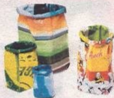
Papierkübel aus Plakaten.